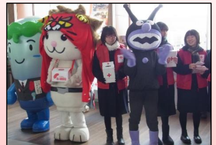
赤い羽根アルバム