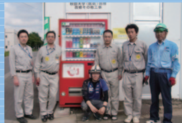
鹿島建設(株)と作業員の皆さん

秋田大学医学部附属病院の改修工事現場に設置されているこちらの自動販売機、実は売上の一部が赤い羽根への募金になる「赤い羽根自販機」なん