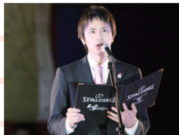
秋田プロバスケットボールクラブ(株)代表取締役社長

これからも秋田のプロチームとして秋田ノーザンハピネットは赤い羽根共同募金の活動を応援してまいります。