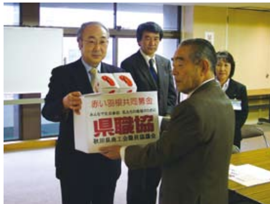
秋田県商工会職員協議会 様