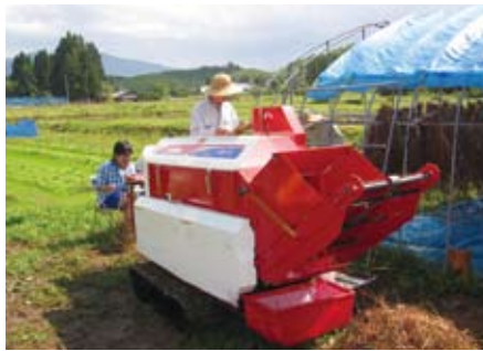
平成21年度助成 (杉の木園・そば脱穀機の整備)