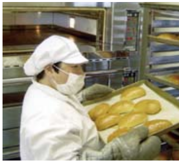
平成21年度助成 (玉の池ワークハウス・パン加工設備の購入)