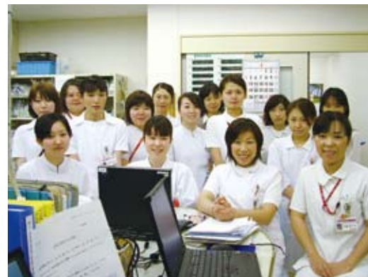
社会医療法人明和会 職員の皆さん

Q 4 社会医療法人明和会としての今後の募金協力に関する抱負などを教えてください。 職員一同、これまで健康に生活してこられたことへの感謝の意味を含め、今後とも共同募金への協力を継続していきたいと思っています。また、当会は昨年2月に社会医療法人としての認可をいただきました。これまでに上に地域医療を追求する法人として、県民・市民に寄り添い、地域貢献の取り組みを進めてまいりたいと考えています。