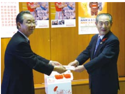
全労済秋田県本部 様