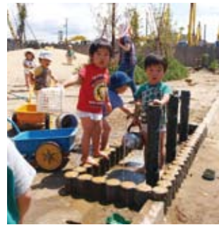
平成20年度助成 (あきたチャイルド園・足洗い場の設置)

Q 3 赤い羽根共同募金のイメージはどのようなものですか？ 赤い羽根の募金が地元秋田に還元される募金であること、支援が必要な人たちのために役立てられている募金であることは、以前からたびたび広報誌などを目にして知っていました。秋田の福祉のための募金というイメージです。