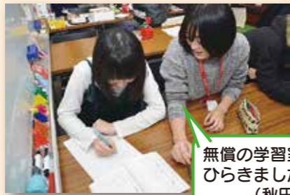
無償の学習室をひらきました(秋田市)