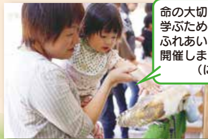
命の大切さを学ぶためのふれあい動物園を開催しました(にかほ市)