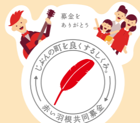
ステッカーデザイン

今年度の運動では、地域によって、今までの赤い羽根の代わりに、このステッカーをご協力のお礼としてお渡しするものです。今までと変わらぬご理解とご協力をお願いします。