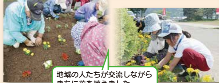
地域の人たちが交流しながらまちに花を植えました(由利本荘市・三種町)