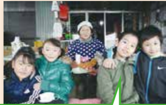
手紙とシクラメンの鉢をもってひとり暮らしのお年寄りを訪問し、交流しました(北秋田市)