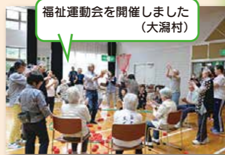
福祉運動会を開催しました(大湯村)