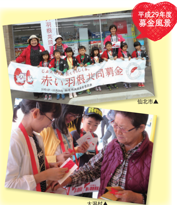
平成29年度 募金風景

社会福祉法の定めにより積立期間が終了し、取崩しとなった過年度災害等準備金4,160,141円を【広域的・先駆的な地域福祉活動への助成】に充当します。(平成30年度募金目標額には含まれません。)