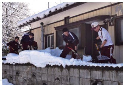
▲除雪ボランティア事業（大館市）

こうした過程を経て実施される助成事業は、幅広い世代が集まる異世代交流会や、地域の皆さんが楽しく汗を流す福祉運動会、厳しい冬を協力して乗り切る除雪ボランティア事業等、年間を通じて各地で実施されています。