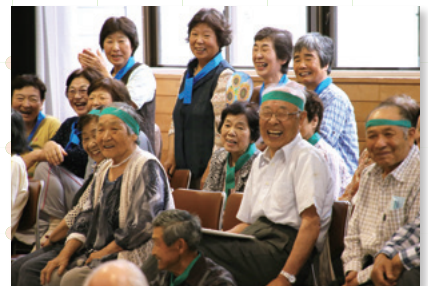
▲福祉運動会事業（大湯村）

共同募金委員会では、地域での募金活動の実施はもちろん、集まった募金を地域で役立てる助成団体の募集と審査を実施しています。審査の方法は様々で、助成団体による公開プレゼンテーションを実施する等、審査過程の可視化や募金の使い道の周知に努めているところです。