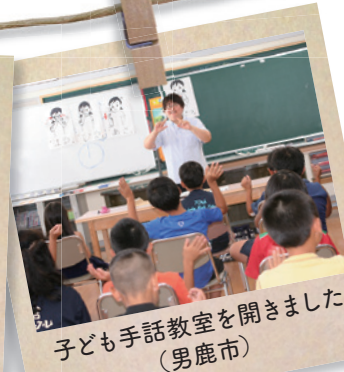
子ども手話教室を開きました (男鹿市)