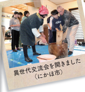
異世代交流会を開きました (にかほ市)