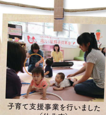
子育て支援事業を行いました (仙北市)