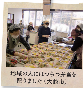
地域の人にはつつ弁当を 配りました(大館市)

QRコードから寄付ページにアクセスすることで、 秋田県の市町村を指定したご寄付が可能です。 (クレジット決済やコンビニ決済が利用できます。)